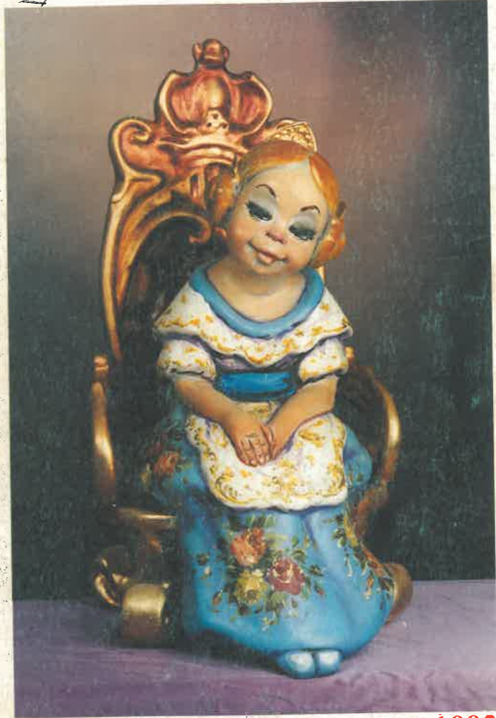
TAVERNES DE VALLDIGNA, 1992